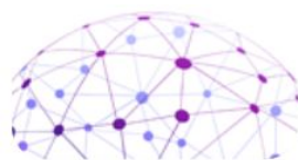
了解图书馆外部环境