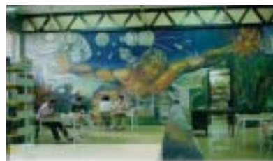
Biblioteca José Martí del Sistema Bibliotecario UJAT

La Biblioteca José Martí es la biblioteca más antigua de la Universidad, la cual fue inaugurada en 1944. La Biblioteca José Martí alberga diversas y valiosas colecciones de libros raros y antiguos de personajes ilustres del estado, entre las que se encuentran: las Colecciones "Francisco J. Santamaría", "Justo Sierra", "José Martí", "José Domingo Ramírez Garrido", "Instituto Juárez", "Atirsipe Figueroa", "Antonio Ocampo Ramírez", "Tabasco", la Colección Hemográfica "Angel Pacheco Morgadanes" y la Colección "Bernardo del Aguila Figueroa" ¡Bienvenidos!