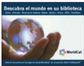
Muestra del Afiche promocional

Respondiendo a la solicitud de su casa productora, las siguientes bases de datos - actualmente ofrecidas por medio de OCLC FirstSearch- dejarán de estar disponibles a partir del 1ro del julio de 2004: Internet and Personal Computing Abstracts (InternetPCAbs), CINAHL, Facts on File y Health and Wellness Information Center. Los usuarios de estas bases de datos pueden considerar las bases de datos Applied Science y Technology Abstracts, Article First y Wilson Select Plus para el área de tecnología; MEDLINE y MDXHealth Digest para el área de salud. Por favor escriba a america_latina@oclc.org para cualquier consulta al respecto.