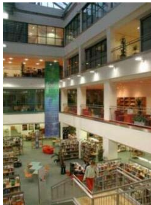
Blick in den Lichthof

Die angeschlossene moderne 3M-Buchsicherungsanlage mit Kontrollschranken an den Ausgängen schützt vor unerwünschtem Schwund und ermöglicht gleichzeitig die Einführung von Selbstverbuchungsstationen.