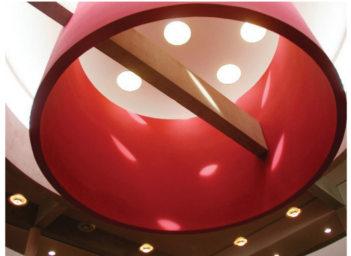
Université Vercors (le Mans).

Bien que les services d'information en ligne SINDBAD de la Bibliothèque nationale de France et Biblioses@me de la Bibliothèque publique d'information de Paris aient