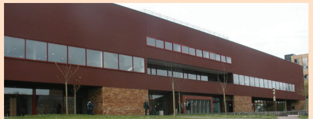
Université Vercors (Le Mans).