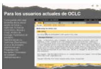
Pantalla introductoria del tutor (1)