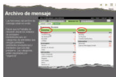
Secciones detalladas e instructivas (3)