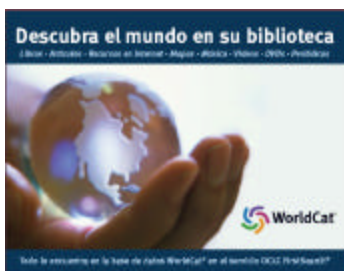
Muestra del Afiche promocional

http://www2.oclc.org/oclc/firstsearch/eco/index.asp . ☺