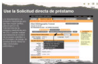
Secciones detalladas e instructivas (2)